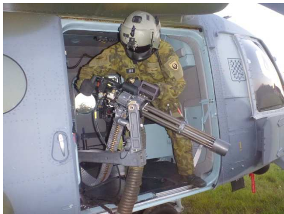
Obr. 2: Já v přestrojení :.D

Pro nadšence, mrkněte na: www.armadinoviny.cz/m-134d-h-minigun-pro-ceske-vrtulniky-mi-171s.html