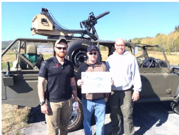
Obr. 1: Příslušníci firmy vyrábějící minigunn.

Možnost montáže na bojová vozidla, vrtulníky, letadla.