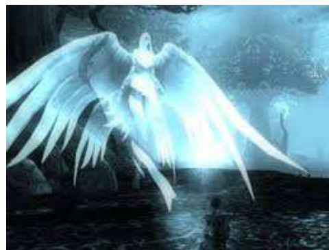
Foto: http://dvasmajlici.blog.cz/1110/tajemna-postava Karina Kučerová, VI. A