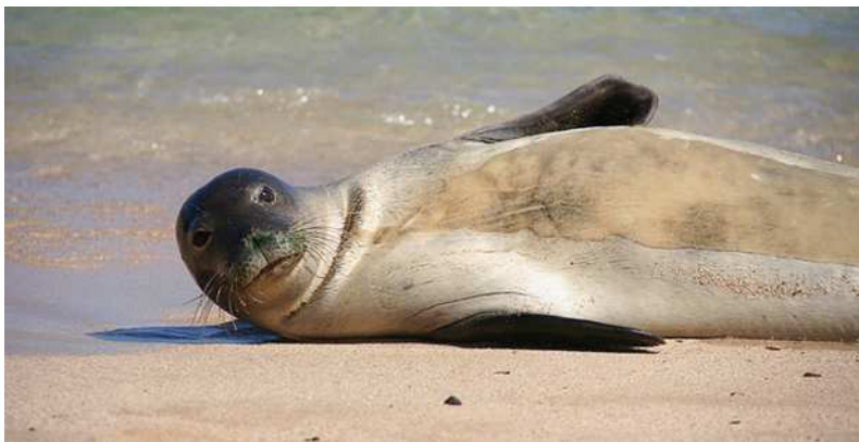
Foto: https://zoomagazin.cz/tulen-havajsky-dostal-nove-jmeno/ Tereza Sabo a Dominika Dillingerová, V. A

Zdroj: https://prezi.com/tjvqy8kyoh_2/tulen-havajsky/ , http://www.rozhlas.cz/leonardo/priroda/_zprava/rasy-ohrozuj-havajske-tulene--905014