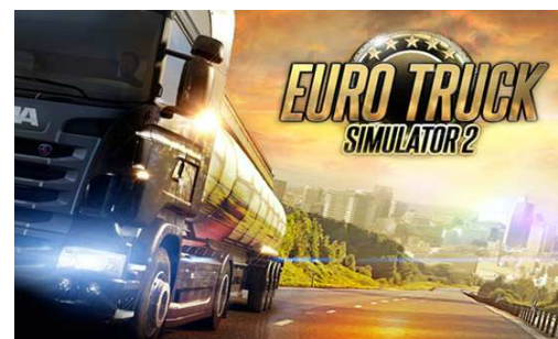
Foto: http://www.bundlestars.com/all-bundles/euro-truck-simulator-2-collectors-bundle/ Marek Polášek, VI. B

Podle mě si tato hra zaslouží 8,5/ 10 bodů. Je to opravdu výborná hra, ale pokud nemáte originální (koupenou) verzi, tak stojí pěkně za *****... teda za nic.: -D