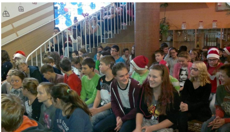
Společné vánoční posezení posilující vzájemnou komunikaci

Besedy, preventivní a intervenční programy pro žáky ve spolupráci s PPP