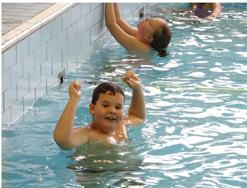
Každý má právo zažít úspěch

Tv - sportovní výkony, překonávání sama sebe, sledování výkonů