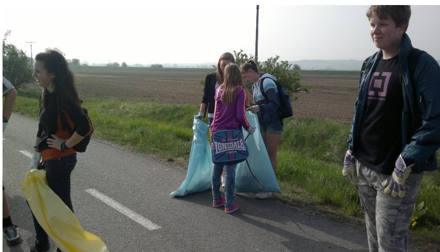
Žáci uklízejí okolí obce, učí se tak úctě k přírodě, člověku

Následovala práce každého učitele nad jednotlivými pilíři etické výchovy, promýšlení kam a kdy ve výuce zařadit či zdůraznit již existující prvky etické výchovy. Na první pohled to vypadá jednoduše, ale není. Je potřeba hodně práce, má-li být výsledek opravdový.