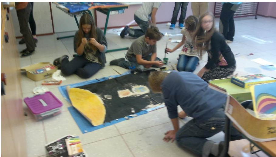
Práce ve skupině učí děti spolupráci