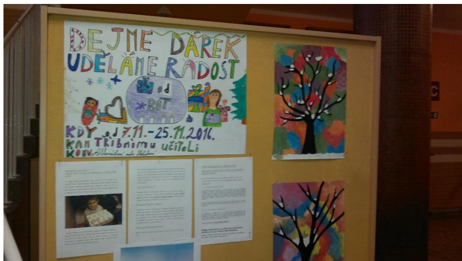
Vyvolat radost, je zásadní v komunikaci citů