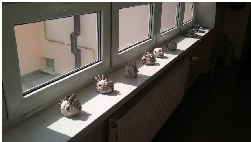
Výstava výrobků žáků ve školní minigalerii